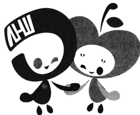
青森県立保健大学 マスコットキャラクター モーリーとリンリン